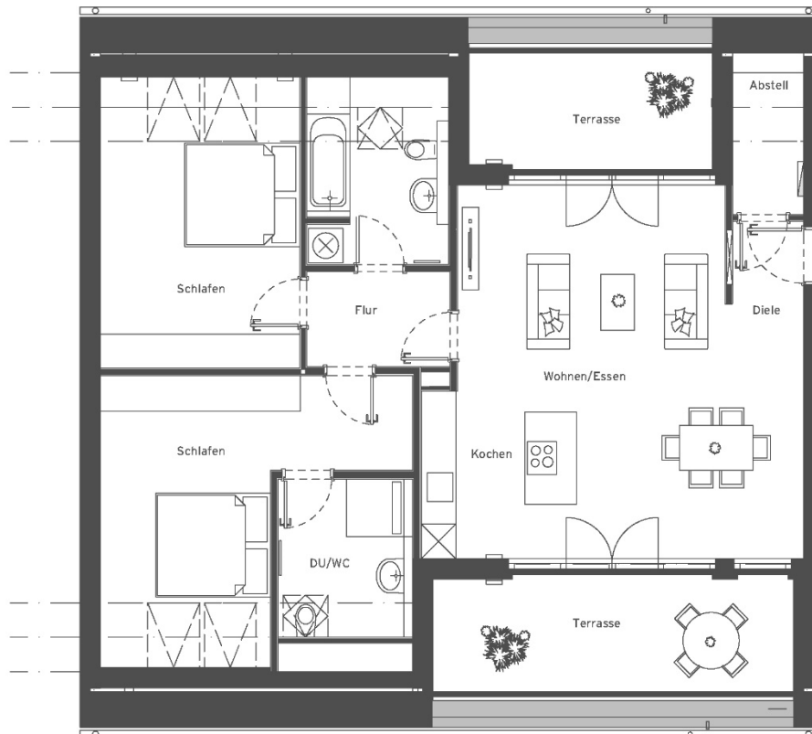
Unverbindliche Illustration (Planung)