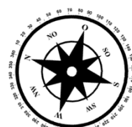
Unverbindliche Illustration (Planung)