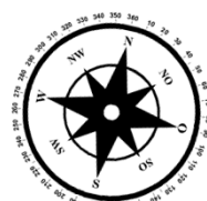
Unverbindliche Illustration (Planung)