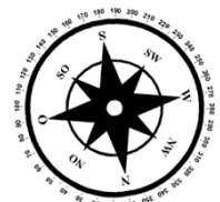
Unverbindliche Illustration (Planung)