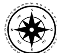
Unverbindliche Illustration (Planung)