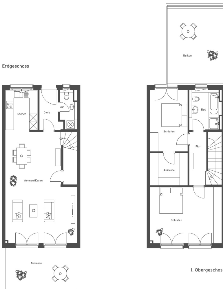
Unverbindliche Illustration (Planung)

GRUNDRISSTYP: C.1 EG & 1. OG: 3-Zimmer-Wohnung Wohnfläche: ca. 136 m 2 Wohnungsnummer: WE 49 Haus: 4 A