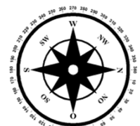
Unverbindliche Illustration (Planung)