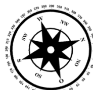
Unverbindliche Illustration (Planung)