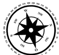
Unverbindliche Illustration (Planung)