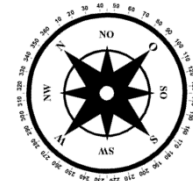
Unverbindliche Illustration (Planung)