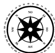
Unverbindliche Illustration (Planung)