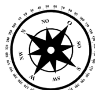
Unverbindliche Illustration (Planung)