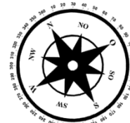
Unverbindliche Illustration (Planung)