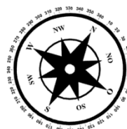
Unverbindliche Illustration (Planung)