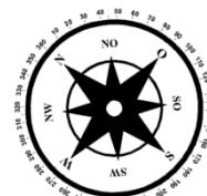
Unverbindliche Illustration (Planung)