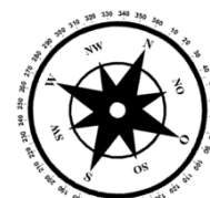
Unverbindliche Illustration (Planung)