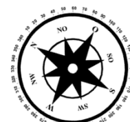
Unverbindliche Illustration (Planung)