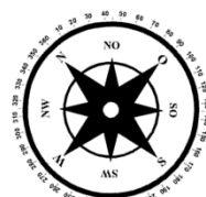
Unverbindliche Illustration (Planung)