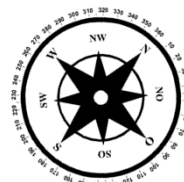
Unverbindliche Illustration (Planung)